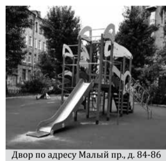
Двор по адресу Малый пр., д. 84-86