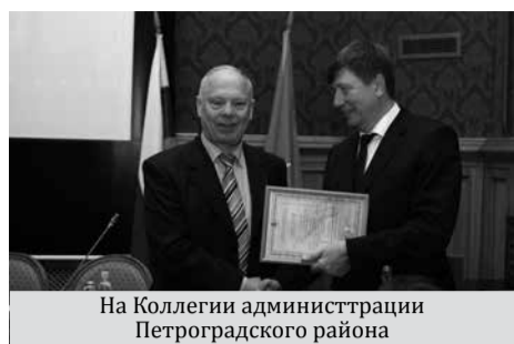
На Коллегии администрации Петроградского района

Общая сумма муниципальных контрактов заключенных по итогам открытых конкурсов, тендеров, аукционах и других конкурсных процедур по отношению к общему