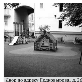
Двор по адресу Подковырова, д. 26

Традиционно, самая затратная статья бюджета муниципального образования - благоустройство территории округа.