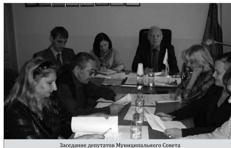
Заседание депутатов Муниципального Совета

В течение 2013 года Прокуратурой Петроградского района проводилась регулярная правовая экспертиза нормативно-правовых актов принимаемых Муниципальным Советом и их проектов. Заседания депутатов Муниципального Совета проводились с