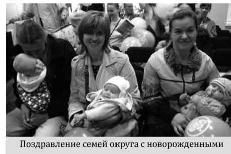
Поздравление семей округа с новорожденными

Проведены традиционные мероприятия для детей из многодетных и малообеспеченных семей: ежегодный семейный праздник, посвященный Дню защите де-