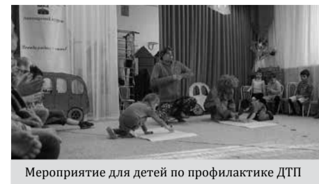
Мероприятие для детей по профилактике ДТП

вали детям о дорожных знаках, разметке и правилах поведения пешехода на дороге, объясняли, для чего существуют правила, и какие могут быть последствия, если их не соблюдать. А чтобы закрепить полученные знания, в игровой форме с использованием дорожных знаков, светофоров и макетов автотранспорта были организованы конкурсы.