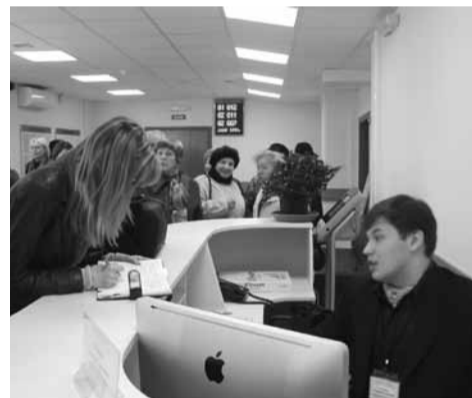
Все услуги Центра для населения – бесплатны.

Открытие Центра – один из этапов реализации антикоррупционной политики в Петербурге: сотрудник центра не может повлиять на принятое впоследствии решение, а клиент не имеет непосредственного контакта с чиновником.